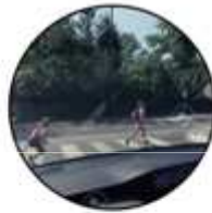
SÉCURITÉ SÛRETÉ DE FONCTIONNEMENT